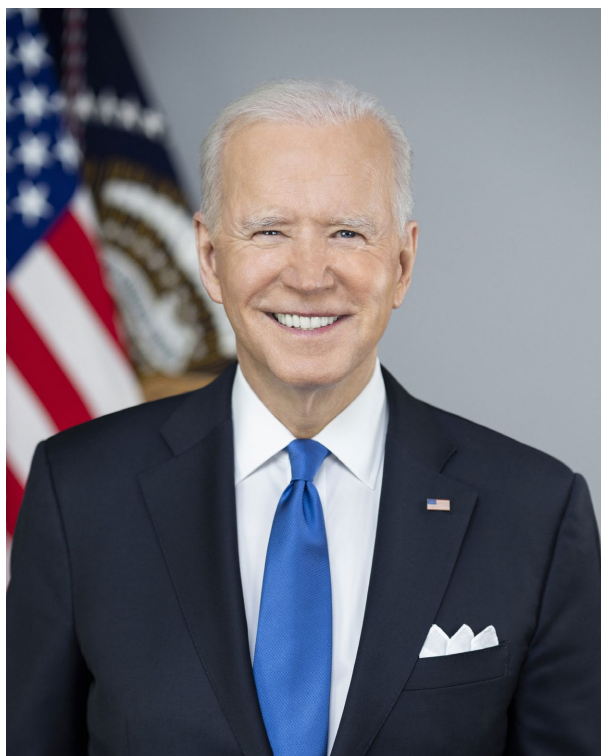
Фото: Джо Байден/ Wikimedia

В інтерв'ю президент України Володимир Зеленський заявляв , що завчасне оприлюднення цієї інформації могло б спровокувати хаос та додаткові втрати для України, зокрема економічні.