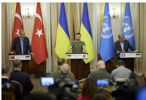
Пресконференція після зустрічі Гутерреша, Зеленського та Ердогана

У Львові відбулися зустрічі генерального секретаря ООН Антоніу Гутерреша , президента України Володимира Зеленського та голови Туреччини Реджепа Таїпа Ердогана . Поміж тем обговорень — напрацювання та спільні дії щодо "зернової угоди", ситуація на захопленій Запорізькій АЕС, примусові депортації громадян України до Росії, а також місія до Оленівської колонії, де загинули десятки українських військовополонених. Міністр закордонних справ України Дмитро Кулеба підкреслив , що під час перемовин не йшлося про жодні поступки з боку України на користь РФ. Раніше йшлося , що Реджеп Таїп Ердоган може запропонувати Володимир Зеленському організувати його зустріч із президентом РФ Володимиром Путіним, але, за повідомленням "Суспільного", після тристороннього саміту президент Володимир Зеленський заявив , що перемовини з Росією можливі лише якщо російські війська залишать незаконно окуповану територію України. На думку Дмитра Кулеби, до завершення війни вирішення багатьох проблем дипломатичним шляхом залежатиме від координації та рішень президентів України, Туреччини та генерального секретаря ООН.