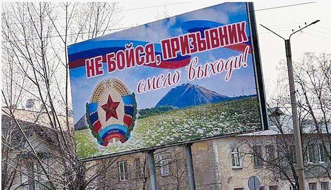
Білборд, розміщений в окупованому Алчевську Луганської області

Коли стало зрозуміло, що призивають масово і примусово всіх чоловіків, окрім тих, кому було видано броню або на підприємствах, або «за гроші», багато хто почав ховатися, кидати роботу й не виходити з дому. Чоловікам старше 55 років стало простіше влаштуватися на роботу, на деяких традиційно чоловічих роботах з'явилися жінки.