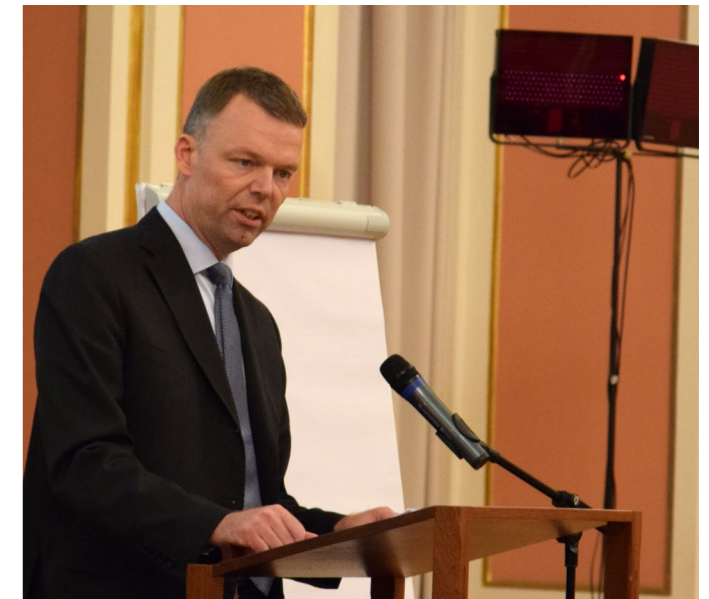
А.Хуг, в минулому Заступник Голови Спеціальної моніторингової місії ОБСЄ у східній Україні